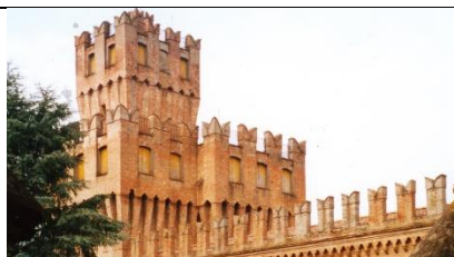
Castello di Galeazza Pepoli