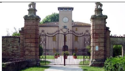
Villa Ronchi di Bolognina