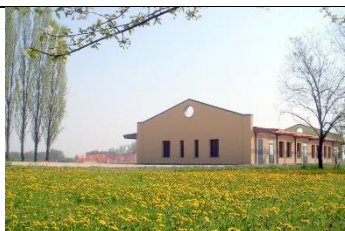
Sede della cooperativa Sammartini