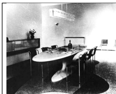
il Tavolo ellittico ideato da Piero Bottoni in una foto del 1940

Per informazioni: https://turismoimolese.cittametropolitana.bo.it/it/esperienze/341760/Villa-Muggia--Alla-scoperta-di-Ville-e-Castelli