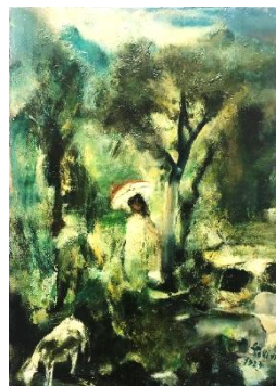
Lea Colliva, Paesaggio visionario, 1929