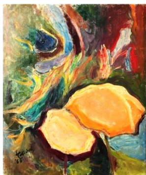
Lea Colliva, Ombrelloni all'Ospitale, 1968,