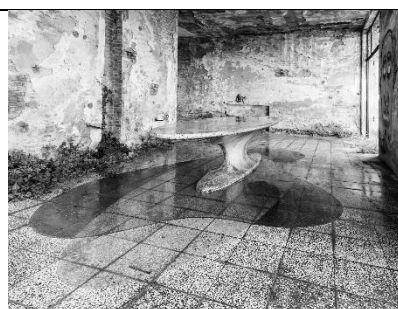
il Tavolo ellittico oggi

L'architetto milanese milanese Piero Bottoni (1903–1973) coltivò vasti interessi progettuali ( architettura, urbanistica, restauro, allestimento, design e arredamento ) in un intenso rapporto