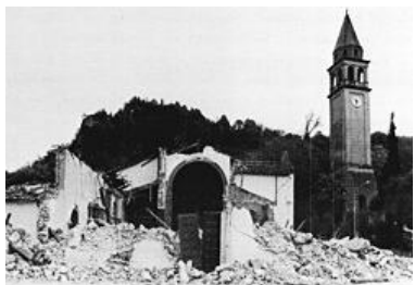
La Pieve di Osoppo