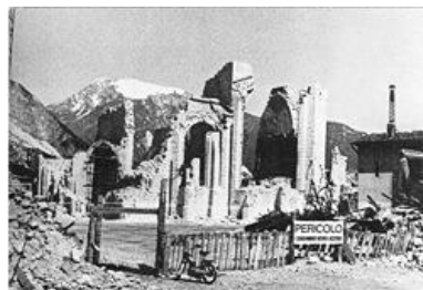
Il duomo di Venzone